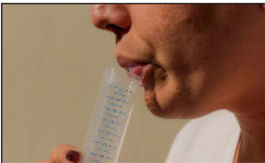
Salivar sense escopir dins del tub gran