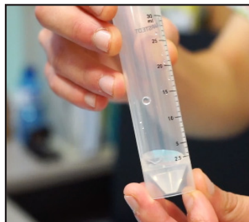
Omplir el fons cònic del tub